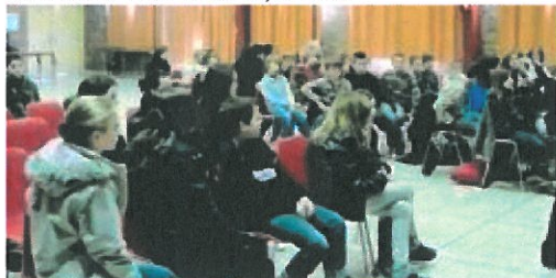
Un public attentif a découvert "Invictus"

Dans le cadre de la semaine de lutte contre le racisme, le service jeunesse, en partenariat avec l'association Cinéligue, la Flasen et le collège Jean-Rostand, a organisé une séance de cinéma, salle polyvalente.